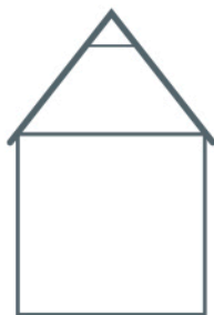
ILLUSTRATION Gavl med saddeltag.