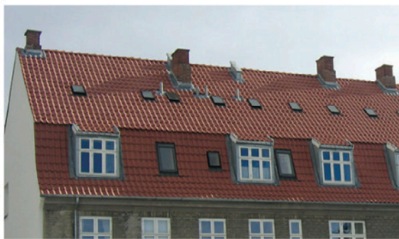
EKSEMPEL Gavl og side af bygning med mansardtag.

Den underste del af taget er særdeles velegnet til indretning af tagbolig, da de lodrette tagflader vil give næsten samme rumfornemmelse som i en almindelig etagebolig.