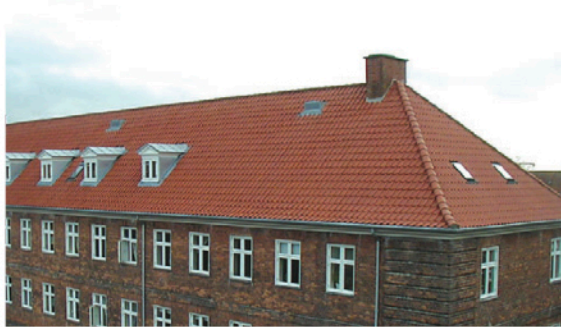
EKSEMPEL Gavl og side af bygning med saddeltag.

Saddeltaget vil normalt være velegnet til etablering af tagboliger, da konstruktionen er meget stabil. Tagboligerne indrettes i den del af taget, der er under hanebåndet. Taget over hanebåndet kan indrettes til hems eller man kan lade boligen gå til kip. Er taghældningen under 45 grader bør man overveje at forny eller ændre tagkonstruktionen for at opnå en tilfredsstillende "rum bredde".