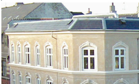
EKSEMPEL Hjørne og side af bygning med københavertag.

Ved et Københavner tag er rumhøjden ofte lav. Det vil derfor ofte være nødvendigt at hæve tagkonstruktionen for at få den lovpligtige højde.