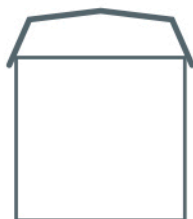
ILLUSTRATION Gavl med københavertag.